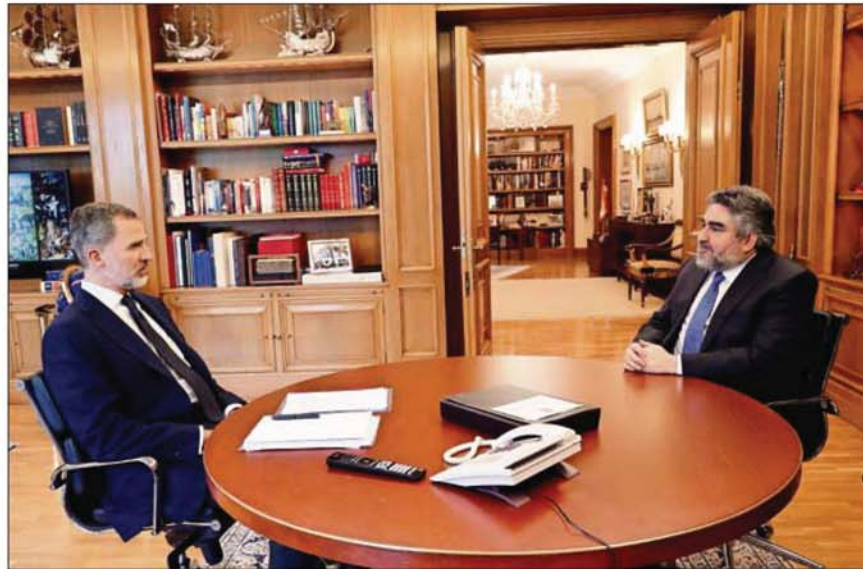
El rey Felipe VI se reunió con el ministro José Manuel Rodríguez Uribes.

Rodríguez Uribes ha señalado que la cultura tiene unas «carencias históricas y estructurales», por lo que la crisis del coronavirus ha supuesto «un golpe muy fuerte» que obliga a «completar la red de protección» en esta primera fase, de «estado de alarma y confinamiento», tanto para la cultura como para el deporte.