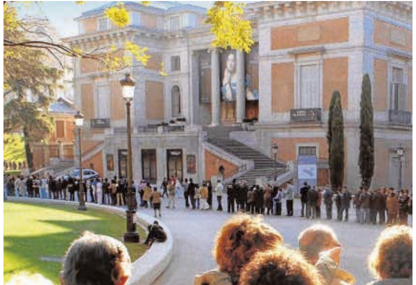
Numerosas personas hacen cola ante el Museo del Prado en una imagen de archivo.

Solamente el 13% considera que en 2021 se recuperará el nivel