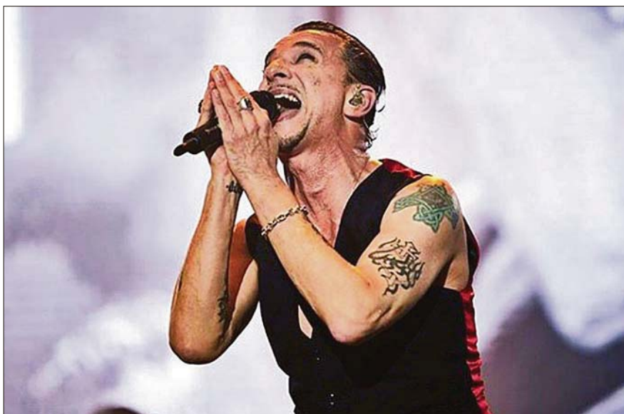
Depeche Mode, durante su actuación en el Mad Cool Festival de hace dos años.

Respecto al futuro, un 47% no espera poder volver a su actividad normal hasta el tercer trimestre, a