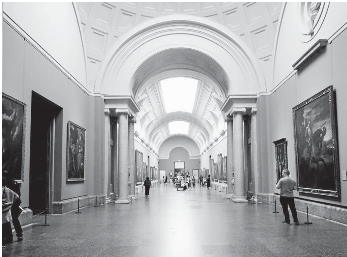
Interior del Museo de El Prado.