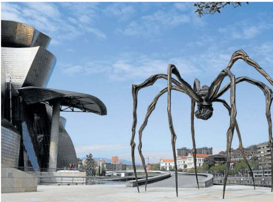
La explanada del museo Guggenheim de Bilbao, donde la obra 'Mama' de Louise Bourgeois, sin paseantes en el 41º día de confinamiento.