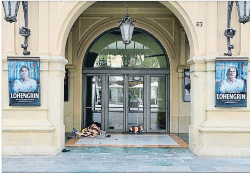
Una imagen de la entrada al Gran Teatre del Liceu durante la jornada de Sant Jordi

Para asegurar su supervivencia, el sector reclama a las administraciones desde ayudas económicas extraordinarias a las industrias culturales, proporcionales a su peso en la economía, a ayudas directas a los creadores y profesionales más desprotegidos. Y quieren representantes de la cultura en los planes de desescalada. A medio plazo, ven ne-