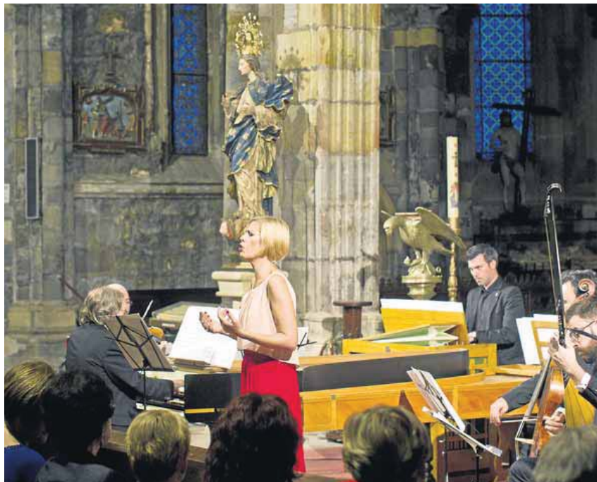
Concierto de música barroca dentro del ciclo 'Marcos Históricos' del FIS celebrado en Castro Urdiales. J. COTERA

▶ Pérdidas. En el sector privado más del 50% espera perder más de la mitad o la totalidad de sus ingresos anuales.